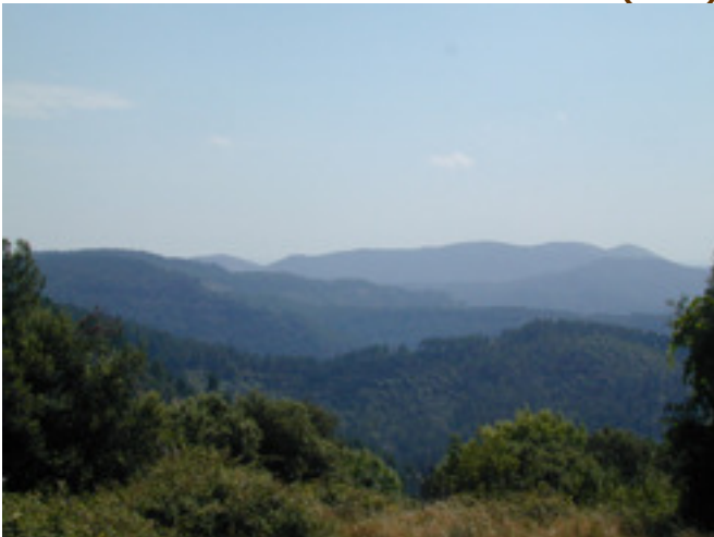
Vergezicht vanuit Tarabias