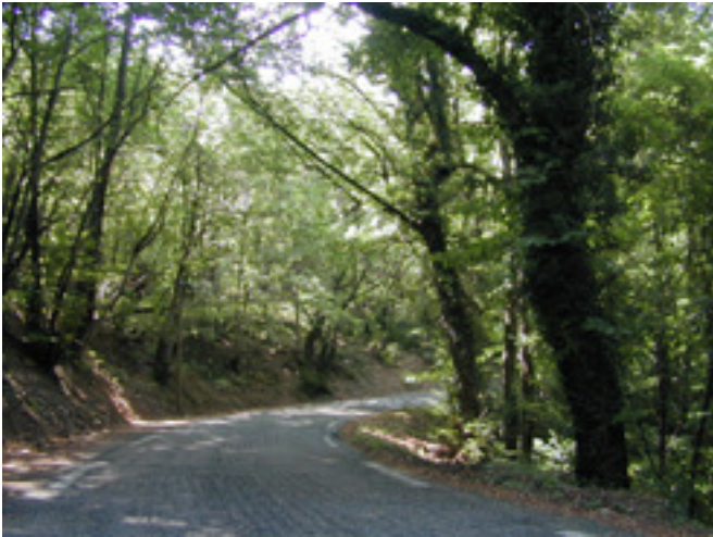
Onderweg van Peyremale naar Chambon