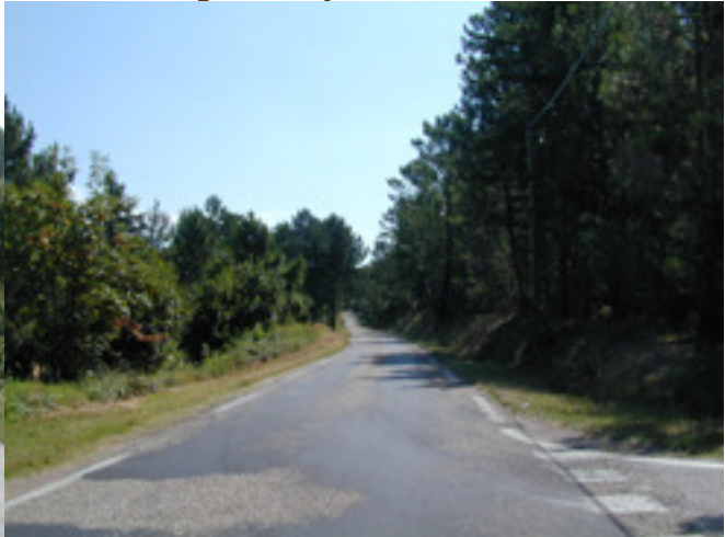
De weg door het bos bij Tarabias