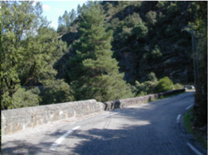
Onderweg van Peyremale naar Chambon