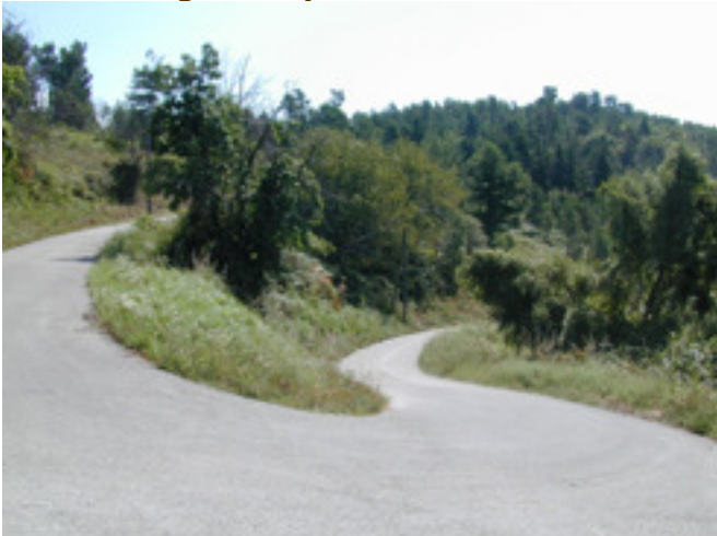
De laatste bocht van de klim uit Chambon (15%)