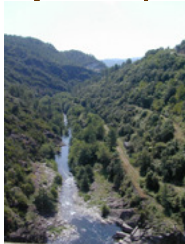
Blik vanaf de stuwdam van Sénéchas

Mas Bernadis Les Bois 30160 Robiac Rochessadoule France